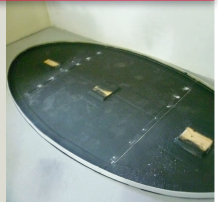
3-teiliger Boden, montiert